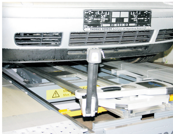
Dank dem bluetooth-gesteuerten Einmess-Schlitten (vorn) wird auf dem PC angezeigt, ob und wo das Fahrzeug verzogen ist.

Darüber hinaus ist der Worpsweder Fachbetrieb Unfall-Fachspezialist, der professionellen, umfassenden Service im Falle eines Unfalles bietet. Dazu gehören unter anderem ein 24-Stunden-Abschleppdienst, Reparatur nach Herstellervorgaben, geschultes Fachpersonal und Hilfe bei Versicherungsformalitäten.